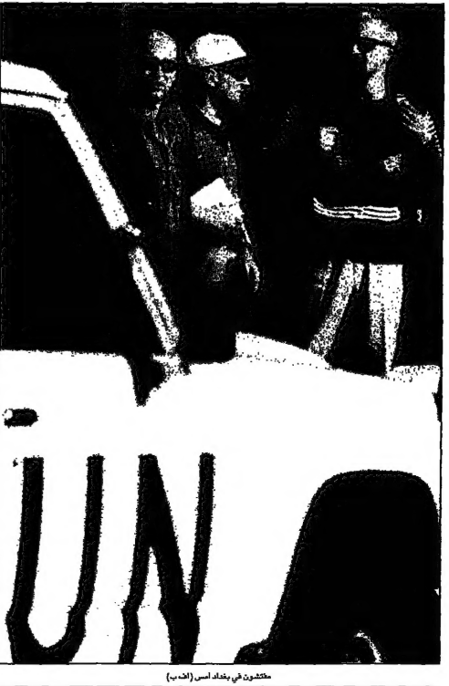
مكتون في بغداد

شم الشيخ (يمين) - يلتقي جيمس كوهين مع الرئيس المصري حسني مبارك أمس الخميس من اجل دعم كوهين في زيارته الى العراق التي يقودها مع وفد من دول الخليج، وذلك في اطار حشد التأييد لضرب العراق.